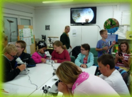
Innenraum des i-Punkt-Natureum

Der Förderverein unterstützt den Tierpark Gettorf bei der möglichst artgerechten Haltung seines Tierbestandes. Er fördert die zoopädagogische Arbeit vor Ort, z.B. durch Maßnahmen, die auch Menschen mit persönlichen Handicaps, Senioren, Jugendlichen und Kindern einen erlebnisreichen Tierparkbesuch bieten. Das i-Punkt-Natureum sowie das Klaus-Jöhnk-Haus bieten während der Tierpark-Saison als "ForscherCamp" allen Besuchern (vorrangig Kindern & Jugendlichen) unter wechselnden Themen, ohne zusätzliche Kosten, interessante Informationen zu den Tieren.